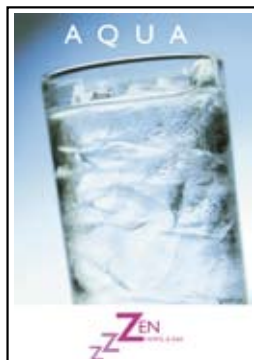
Kartki pocztowe A4