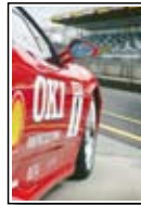
Kartki pocztowe A6