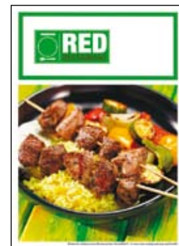
Dwustronnie drukowane menu A4