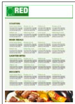
Banery o wymiarach maksymalnych 215 x 1200 mm